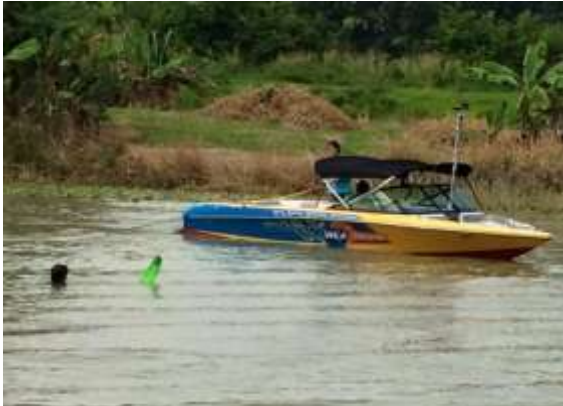
2013 SKI NAUTIQUE OB 200